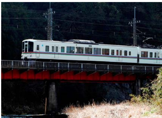
武蔵横手駅～東吾野駅間を走る 4000 系車両