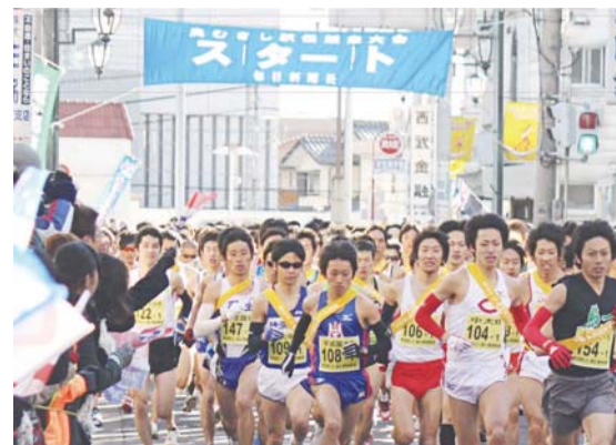
奥むさし駅伝競走大会 昨年スタート時の様子