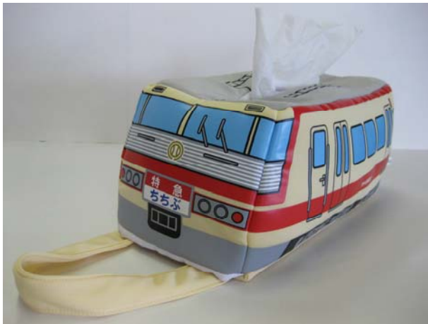
ボックスティッシュケース 5000 系レッドアロー (イメージ) ※ティッシュは付いていません