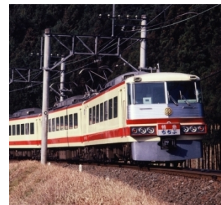
<初代レッドアロー号(5000系車両)>

「レッドアロークラシック タッチアンドゴー」は、10000系車両(上写真)を「初代レッドアロー号(5000系車両)」（下写真）の塗装色に変更した車両がデザインされています。 デザインは「レッドアロークラシック」運行開始当日までのお楽しみです。