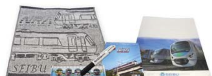
西武鉄道オリジナルノベルティグッズ(非売品) ※写真はイメージです。