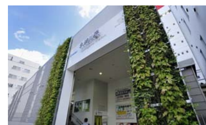
<緑化を施した久米川駅北口>

2008年度より、駅をご利用のお客さまに潤いと安らぎの空間を提供するとともに快適にご利用していただけるよう、緑化の実施をしています。2008年度は小手指駅・西武球場前駅・航空公園駅、2009年度は本川越駅・久米川駅、2010年度は入間市駅の緑化を実施しました。