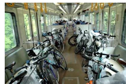
<サイクルトレイン車内の様子>

2007年に国内で初めて「回生電力貯蔵装置」を2ヵ所の変電所に導入しました。この装置は、回生車両がブレーキをかけた際に車両に搭載した回生ブレーキにより発電した電気エネルギーを、変電所に設置した「回生電力貯蔵装置」に貯蔵し、電車が力行（発車・加速時）する時に貯蔵した電力を放出するものです。これにより、電力使用量を削減し、省エネルギー化を図っています。