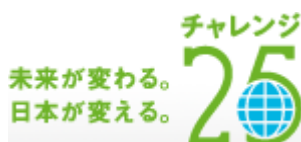
アニッコ (Anime&Eco) Vol.10 表紙と活動紹介ページ