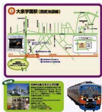
「アニメゆかりの地 ぶらぶら散歩」表紙 マップ掲載内容

「SEIBU でいく アニメゆかりの地 ぶらぶら散歩」創刊: 2011年3月26日に創刊。西武沿線のアニメ施設などを紹介するアニメ観光マップ。沿線のアニメスポットの魅力を余すところ無く紹介していきます。日本動画協会と西武鉄道が主催している「アニメのふるさとプロジェクト」は、「アニッコ」や「アニメゆかりの地ぶらぶら散歩」の配布などを通し、沿線地域と子どもたちを始めとしたみなさまに、笑顔が届けられるよう、地域資源を活かした魅力あるまちづくりに協力しています。