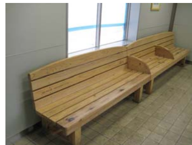
<ベンチに地元産木材を利用した狭山市駅ホーム待合室>

2009年度は芦ヶ久保駅、狭山市駅などのホーム待合室に地元産木材で製作したベンチを設置しました。ご利用のお客さまに木のぬくもりを感じていただくとともに、環境への関心を高めていただくよう努めています。