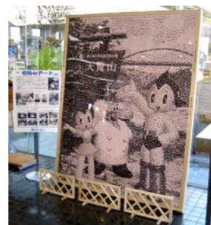
<2008年10月に飯能市内で実施した「切符 de アート」>

地元の小学生らと使用済み切符でアニメキャラクターのモザイク壁画をつくるイベントです。「子どもたち」「ふれあい」「地域コミュニティ」「環境」をテーマとして、使用済み切符を利用することで『リサイクル(Eco)』を体験・意識していただくことが目的です。