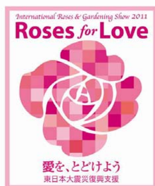
〈復興支援バラシール〉

みなさまからのご厚意によって集まりました義援金は、会期終了後、「国際バラとガーデニングショウ」公式 web サイト上にてご報告させていただきます。 http://bara21.jp/ (PC/モバイル共通)