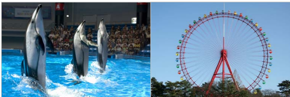
＜ 左：エプソン品川アクアスタジアム水族館 イルカショー 右：西武園ゆうえんち 大観覧車 ＞