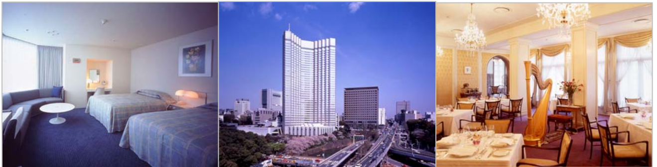
＜ 上左：グランドプリンスホテル赤坂 ツインルーム 上中：グランドプリンスホテル赤坂 外観 上右：グランドプリンスホテル赤坂 仏蘭西料理「トリアノン」 ＞