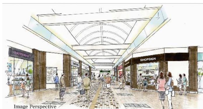
2011年(平成23年)春完成時 東西自由通路内観イメージ