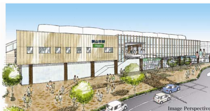
狭山市駅完成予想イメージ(西口)