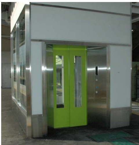
ホームに設置されるエレベーター