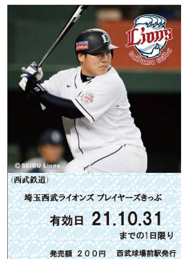
「埼玉西武ライオンズプレイヤーズきっぷ」のデザイン （左から岸投手、中島選手、片岡選手、中村選手）