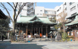
境内にある末社富士浅間神社

江戸時代、米・塩・酒・薪・炭などの物資がここ鐵砲洲の湊に入ってきたため、鐵砲洲稻荷神社の生成太神(いなりのおかみ)の名は船乗人の海上守護の神として全国に広まりました。安藤広重の名所江戸百景にも『鐵砲洲稻荷橋湊神社』として描かれています。