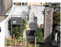
日本橋魚河岸跡 関東大震災まで江戸・東京の台所でした。