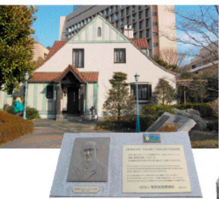
トイスラー記念館

明治時代、外国人居留地だった築地明石町付近。このエリアには、聖路加病院の初代院長トイスラー氏がゲストを迎えるための宣教師館として使用していたトイスラー記念館をはじめ、芥川龍之介生誕の地、浅野内匠頭邸跡などの史跡もあります。