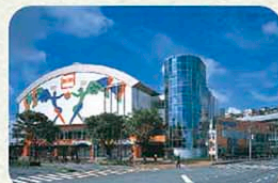
BIG BOX 東大和

⑩野火止緑地 野火止橋付近に広がる雑木林が緑地として保存され、小平市の鳥「コゲラ」など野鳥の観察もできる武蔵野の面影を色濃く残す場所です。