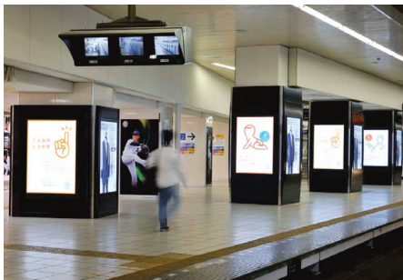
柱巻(池袋駅地下1階)