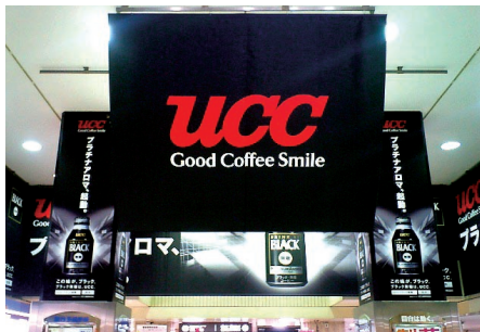
空間利用(池袋駅1階)