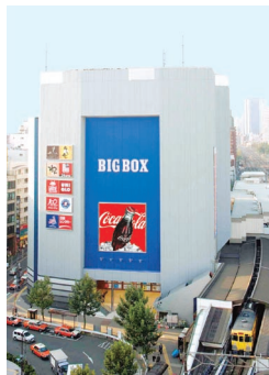
屋外広告(BIGBOX高田馬場)

新たな発想によるスペースの有効活用や、購買行動に直接結びつくような掲出アイデアの実践を行っています。BIGBOX高田馬場壁面の屋外広告など、レジャー施設の広告営業も行っています。